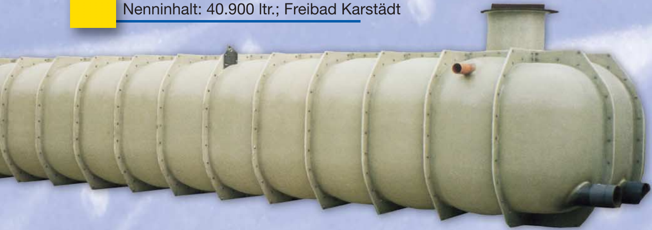
Schwallwassertank unterirdisch – Nenninhalt: 40.900 ltr.; Freibad Karstädt