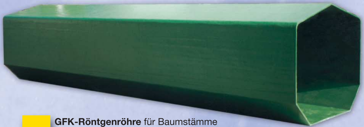
GFK-Röntgenröhre für Baumstämme Kunde: Pollmeier