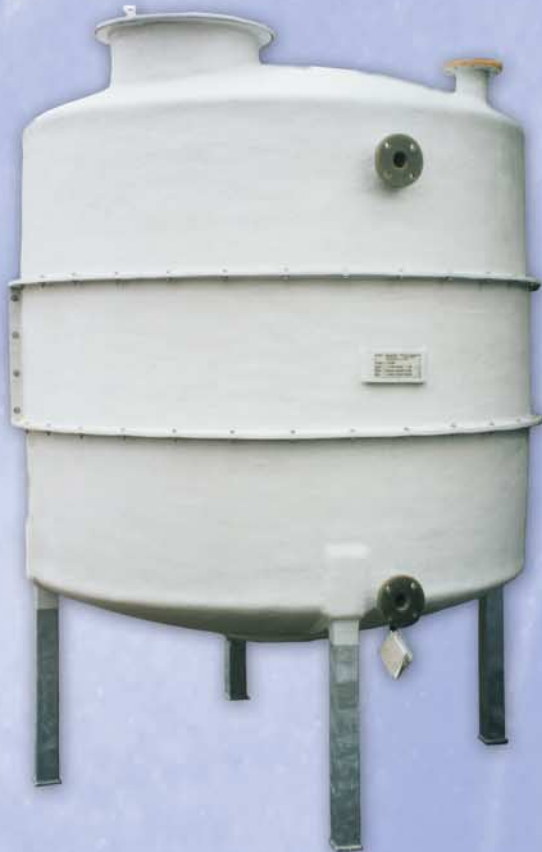
Rundtank stehend mit diversen Anschlüssen Kunde: Hilti