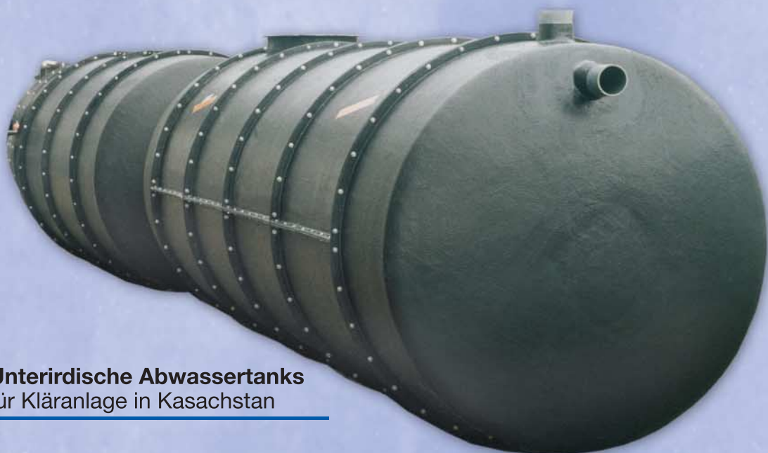
Unterirdische Abwassertanks für Kläranlage in Kasachstan